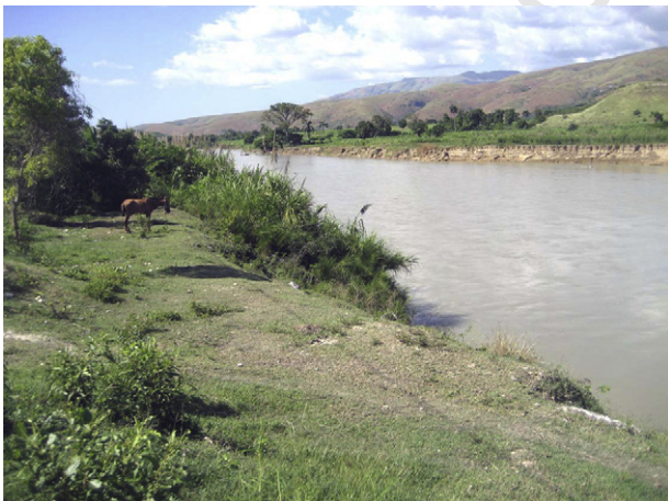
Figura 1. El río Artibonita, a unos pocos kilómetros de Mirebalais.

En octubre de 2010 se notificó al Ministerio de Salud la aparición de casos muy graves de diarrea provenientes de Mirebalais, una población cercana al río Artibonita (fig. 1); a las 48 h se había identificado que el agente causal era el V. cholerae O1, biotipo El Tor, serotipo Ogaba. Dicho vibrio es similar genéticamente a los provenientes de África y Asia (Camerún, India y Nepal), y no tiene relación con los aislados en Perú en 1991 ni con los provenientes de la costa del Golfo americano 11 . Parece ya